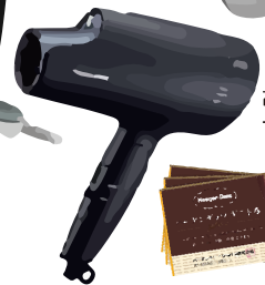
高性能ヘアドライヤー