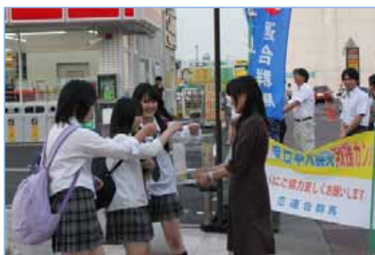
学生も快く協力してくれました(太田駅)

【高崎地協】高崎駅周辺 6月4日(土)13:00~ 皆さんの温かいご協力をお願いいたします。