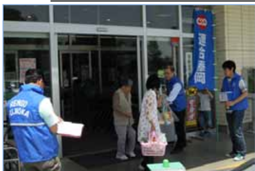
買い物客へ呼びかけ(リセロ藤岡店)