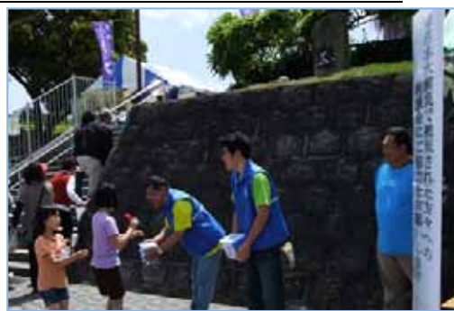
買い物客へ呼びかけ(藤岡 藤の咲く岡公園)