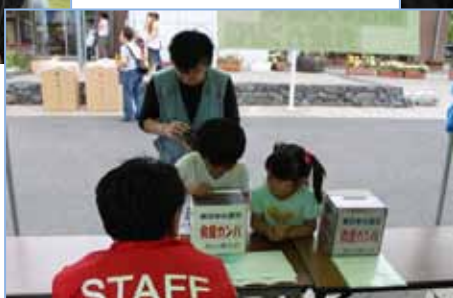
小さな子どももカンパに協力(館林)