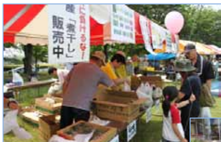
県産野菜と煮干しを販売(伊勢崎)

伊勢崎・沼田・館林会場で、5月22日(日)にふれあいフェスティバルを開催しました。あいにくの雨に見舞われ一部プログラム変更などを余儀なくされましたが、前の週に引き続き茨城産の煮干しと、群馬県産の農産物を販売し、多くの方に購入いただきました。また、各会場では宮城県より直送したウインナーとハムを鉄板焼きにして販売したり様々な場面で義援金を呼び掛けるなど、被災地の復興支援のための取り組みが展開されました。