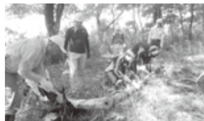
森林整備 赤城神社西