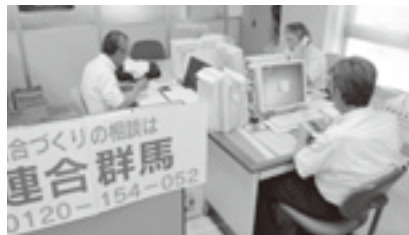
アドバイザーによる労働相談強化