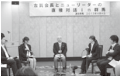
KNT47 古賀会長対話行動