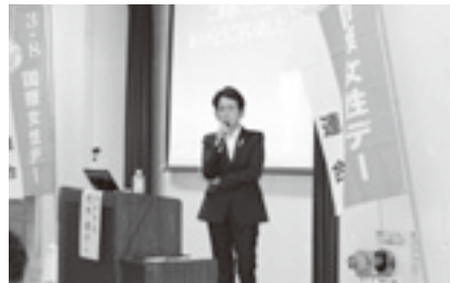
国際女性デー 安中市長講演