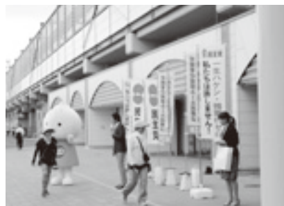
民主党合同駅頭行動