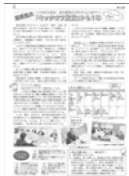
組織拡大重要性のアピール