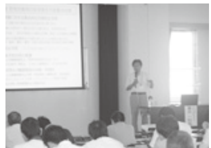
安全衛生セミナー