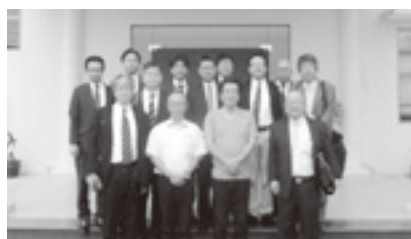
海外視察団 ベトナム