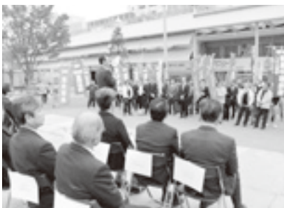
労働者保護ルール改悪阻止行動