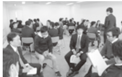
青年委員会 県議と座談会