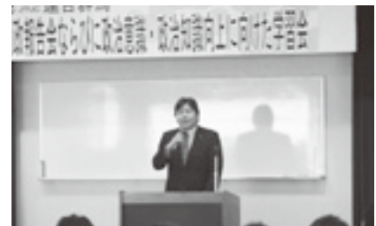
国政報告・政治意識・知識向上学習会