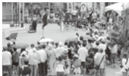
ふれあいフェスティバル (藤岡)