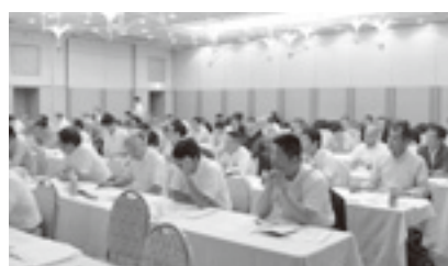
関ブロ地協活動推進会議