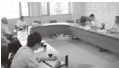
産別との意見交換