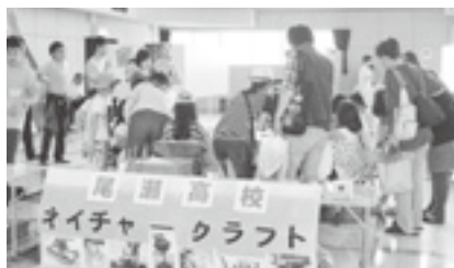
ふれあいフェスティバル (沼田)