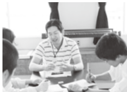
太田東高校公開みらい学