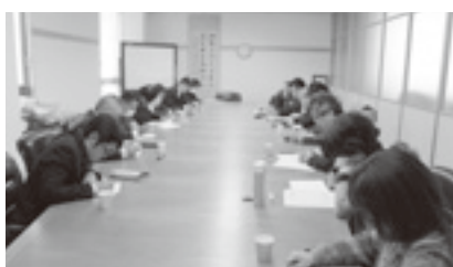
地協再編準備委員会