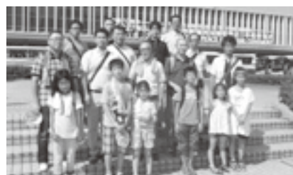
平和広島・親子派遣団