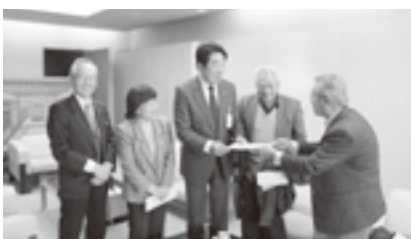
高退連 前橋市へ要請