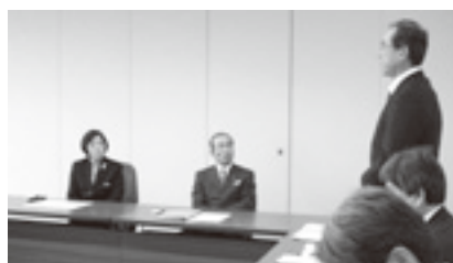
教育委員会申入れ