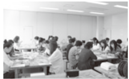
ハンドメイドとアンチエイジング講座