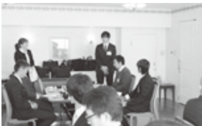
民主党青年部と青年委員会意見交換