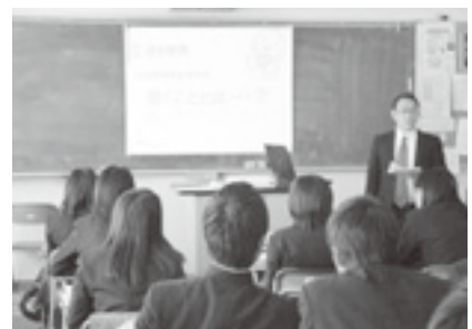
伊勢崎商業高校出前授業