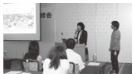
労福協交流研修会