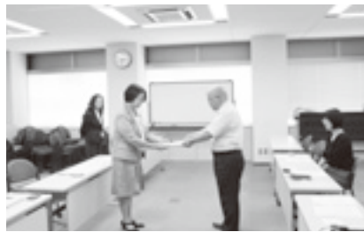
女性委員会 均等室へ要請