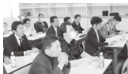
子ども・子育て政策担当者会議