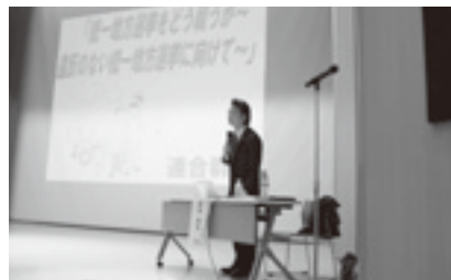
コンプライアンス学習会