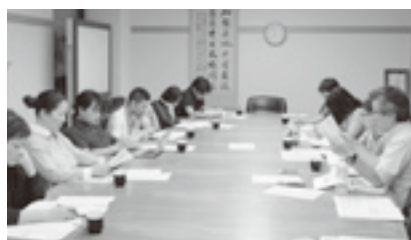
看護・介護現場で働く仲間との意見交換