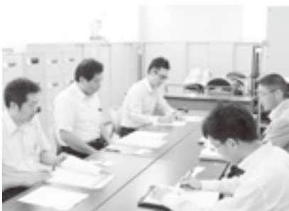
労基署との意見交換 (吾妻)