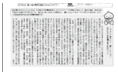
あぶろうちコラム