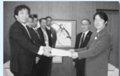
中之条町へ提出（吾妻地協）