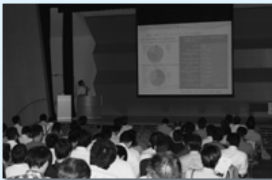
県民意識調査集約結果と提言の考え方を説明