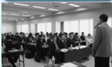
労働運動の歴史など真剣に耳を傾ける新任役員