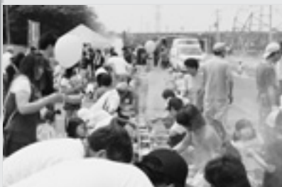
焼きまんじゅう上手に焼けたかな→