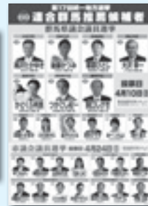
地方選用の推薦候補者一覧ポケット冊子 とポスター