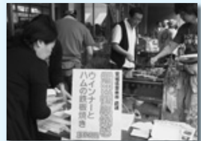
↑被災地復興のウイナー焼き