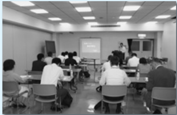
賃金学習会／賃金交渉の必要性などについて学ぶ