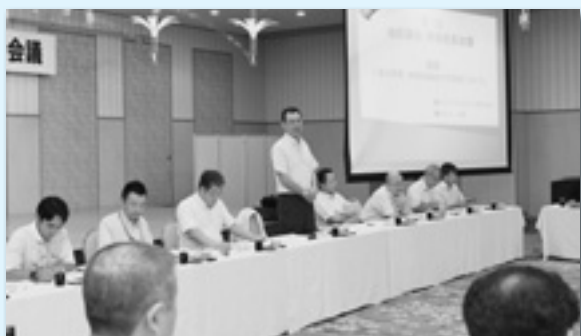
今後のあり方を考える地協議長・事務局長会議