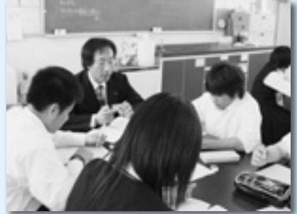
6クラスに分かれて1グループ5、6名の生徒から働くことについて質問を受ける講師