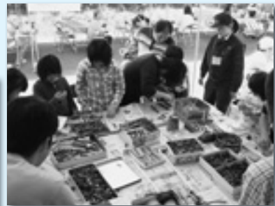
↑何ができるかな？ものづくり教室大盛況 ←ノコギリって難しいけど頑張るよ！