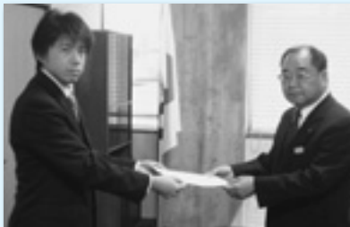
甘楽町へ提出（富岡地協）