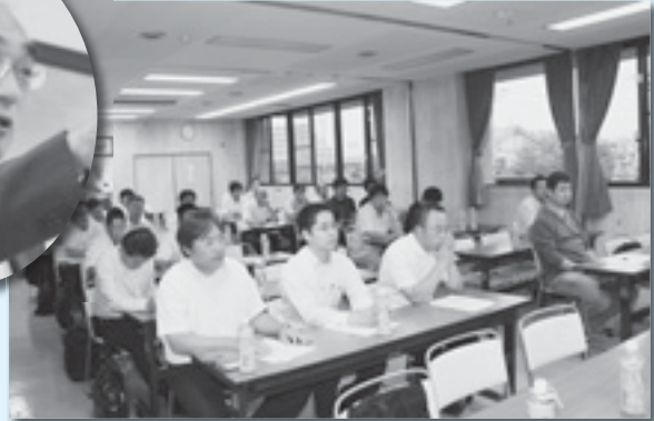
組合づくりについて 熱心に聞き入る（太田会場）