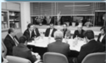
活動強化に向けて役員との意見交換 (前橋地協)