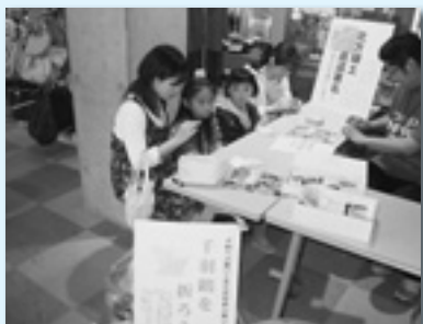
↑千羽鶴で平和を祈ります