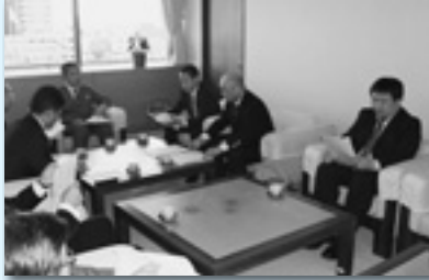
前橋市との意見交換（前橋地協）