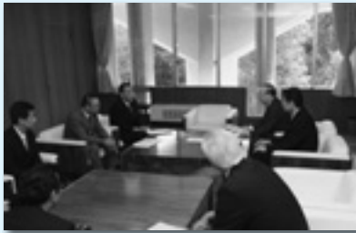
大泉町との意見交換（館林地協）