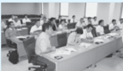
議会基本条例制定に向けた勉強会