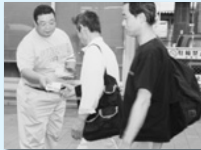
駅頭でティッシュとチラシ配布