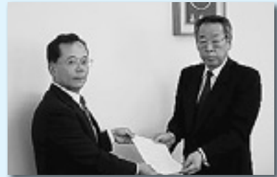
藤岡市へ提出（藤岡地協）