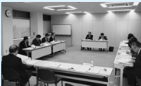
労働局との実務担当者会議