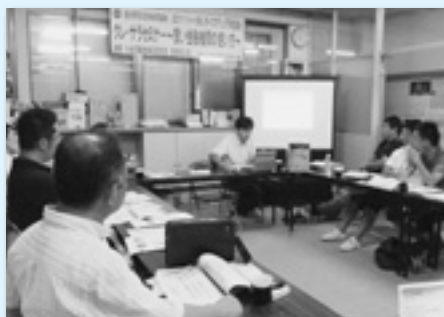
クレ・サラセミナー(沼田地協)