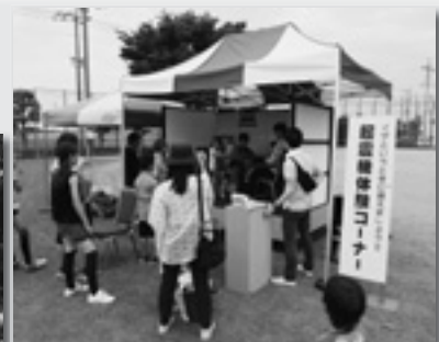
↑起震体験でいざというときに備えます ←〇×クイズ。さあ次はどっち