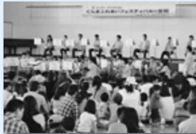
とてもいい音色です→