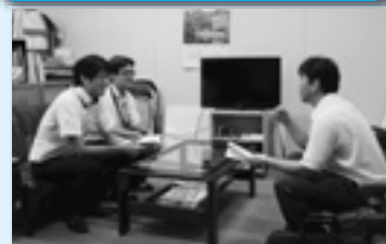
記者と報道について意見交換