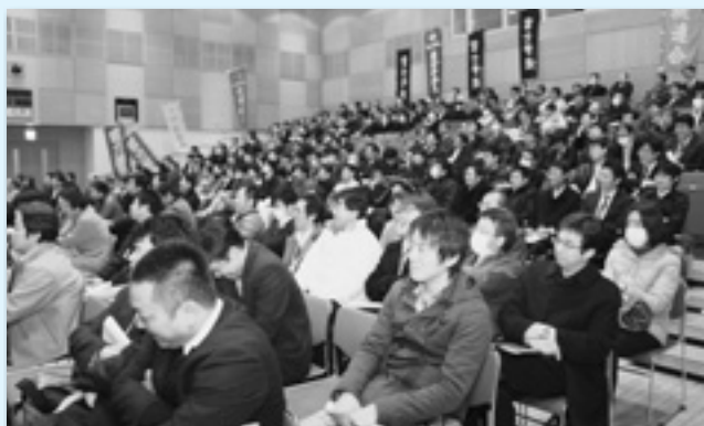
講演に耳を傾ける参加者