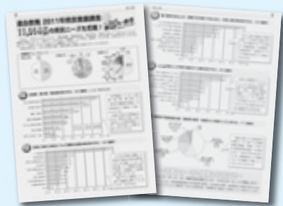
集計結果を機関紙あぶらうちで報告