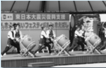
↑大胡風神太鼓の華麗な演技で開幕 被災地支援（農産物販売）→