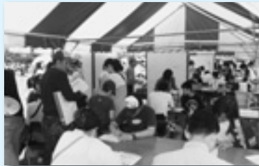
フェスティバルで意識調査