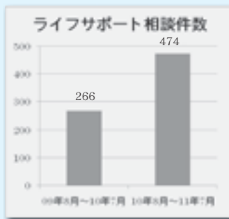
開始から2年の相談件数推移