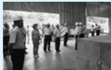
渋川県産材センター視察