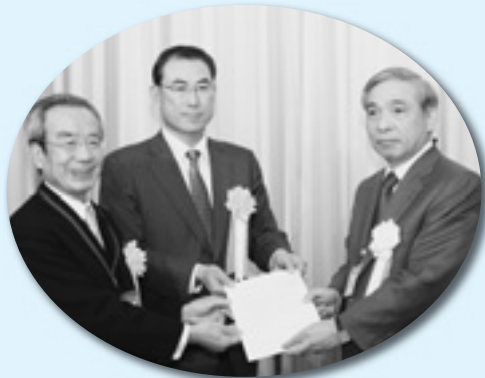
若者の就労観・職業観醸成の取り組みに向けた 労使共同提言(上・群馬県 下・群馬労働局)