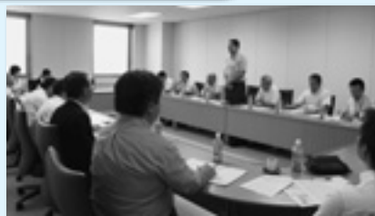
連合群馬の政策や今後の連携について忌憚ない意見交換