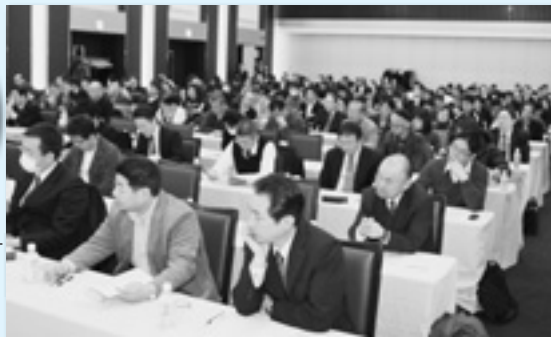
コンプライアンスの重要性などについて学ぶ