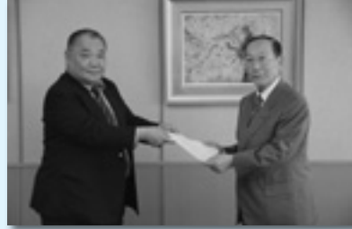
高崎市へ提出（高崎地協）