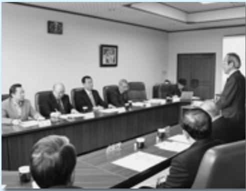
経営者協会との意見交換