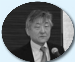
講師：連合本部政治センター 管家事務局長