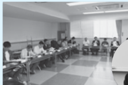
執行部を対象とした学習会