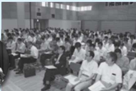
執行部・各種委員・議員懇などが参加