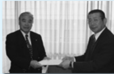
吉岡町へ提出（渋川地協）