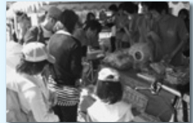
↑クジで何が当たるかな？