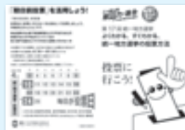
期日前投票 利用促進 PRチラシ