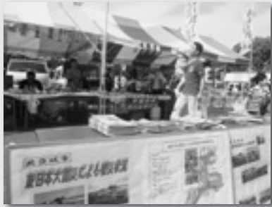
↑北茨城市の復興を願い海産物販売