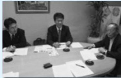
太田市との意見交換（太田地協）