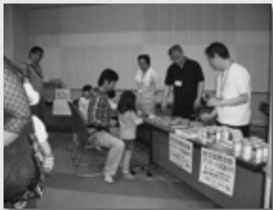
↑全労済「防災診断中」です！