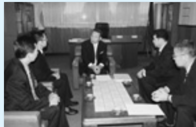
安中市との意見交換（安中地協）