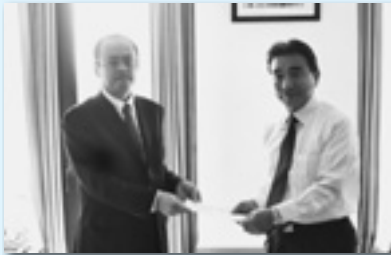
玉村町へ提出（伊勢崎地協）