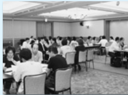
グループディスカッションで様々な職場の人と交流