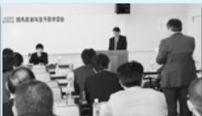
群馬県新年度予算学習会