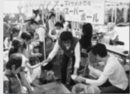
↑スーパーボールすくいは私にまかせて ←連合群馬活動紹介です