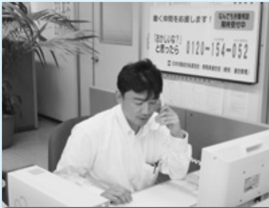
なんでも労働相談ダイヤルに対応する役員