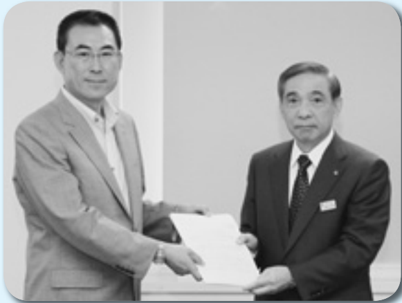
提言書を渡す 北川会長（左）と大澤知事