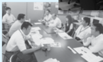
連合長野松本地協