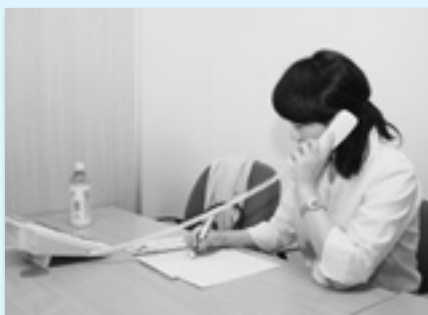
親身に電話相談に応じるカウンセラー