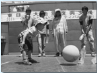
↑エコボウリング「ストライク！」