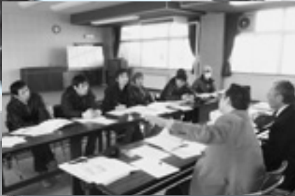
三益半導体工業労組執行委員会