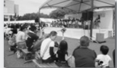
↑チアと子どもたちのコラボ