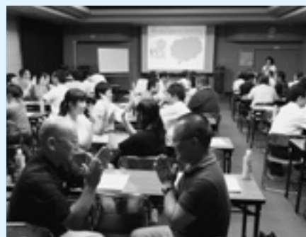
人間関係づくり学習会(館林地協)