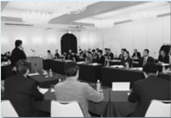
連合群馬ユニオン第12回定期大会