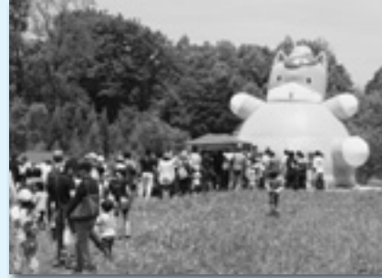
↑毎年、大行列のふわふわ ←ハンカチで口を押さえて煙体験です