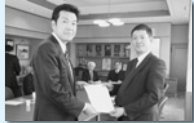
みどり市へ提出（桐生地協）