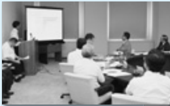
パワーポイントで説明