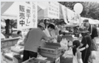
↑煮干しと野菜販売で支援しています