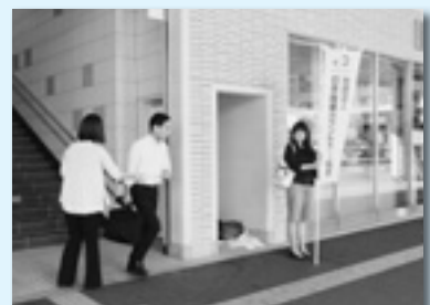
産業カウンセラー協会と連携した自殺予防対策PR活動