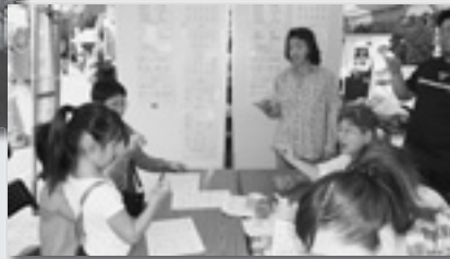
手話教室「わたしの名前は・・・」→