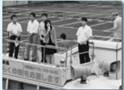
議員と連携した街宣活動(左：太田駅南口 中：新前橋駅東口 右：高崎駅西口)