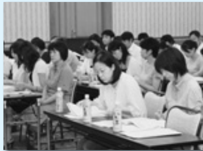
パートタイム労働法について学習