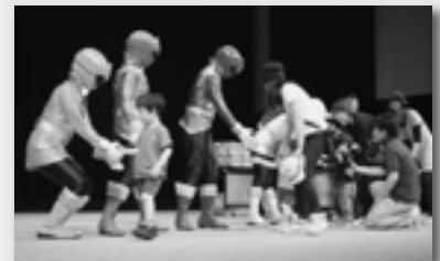
↑ゴーカイジャーも募金の呼びかけ