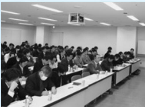
講義に聞き入る参加者