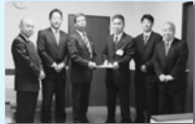
沼田市へ提出（沼田地協）