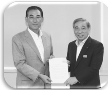
大澤知事と北川会長（左）

昨年 8 月 28 日に群馬県の平成 26 年度予算編成に向け要請書を大澤知事へ提出しました。