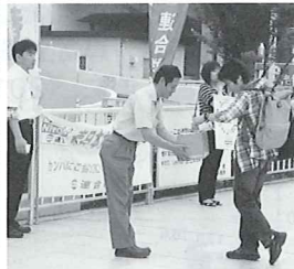
駅頭でのカンパ活動