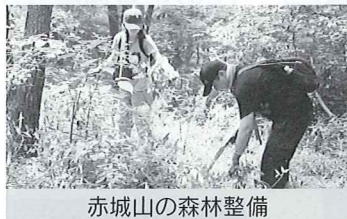
赤城山の森林整備