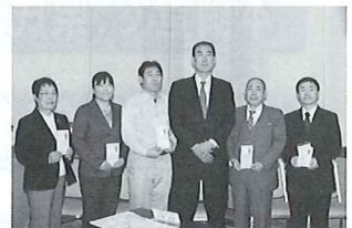
群馬いのちの電話等5団体へ