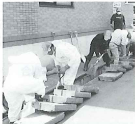
被災地ボランティア