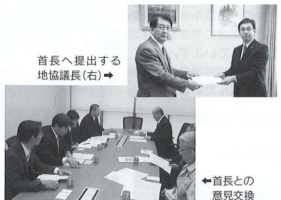
首長へ提出する地協議長(右)→