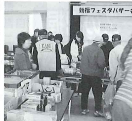
勤福フェスタ被災地支援バザー