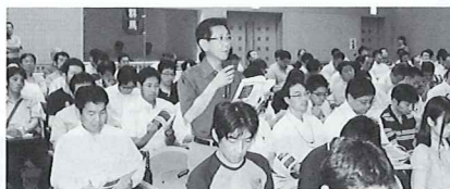
一般市民を含めた政策フォーラムの開催や県議員との意見交換等を行い提言内容を論議します。

県内一円、10代から70歳以上の幅広い年齢層、会社員をはじめ、公務員、自営業、会社役員、専業主婦などさまざまな職業の方に調査協力をいただきニーズを把握します。(2011年は11,014名から回答をいただきました)