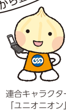
連合キャラクター 「ユニオニオン」