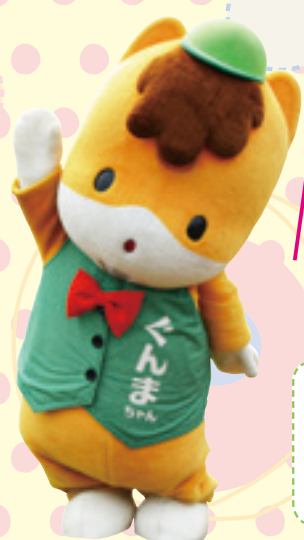
群馬県のマスコット 「ぐんまちゃん」 許諾第 29-101015 号