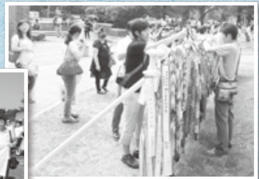
↑長崎 平和公園で折鶴献納 ←核兵器廃絶署名・えんぴつ寄贈