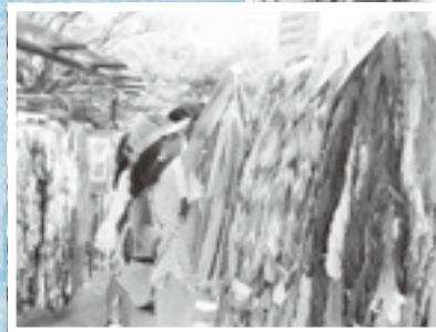
←広島 平和記念公園 折鶴献納