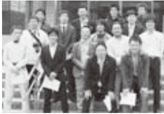
やんば館の前で記念撮影

4月13日、連合群馬青年委員会（6名）と連合埼玉青年委員会（11名）の意見交換会を実施しました。