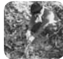
雨で流出しないようにしっかり植えます