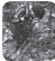
専用工具で穴を掘り